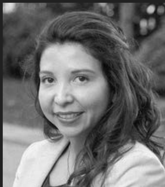
Montserrat Moya Estudio 150