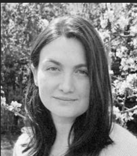
Carolina Rico Empresas IANSA