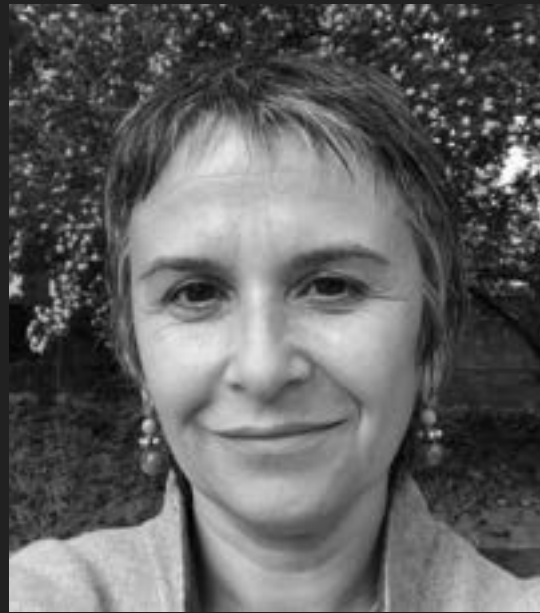
Pilar López Respect Ltda.