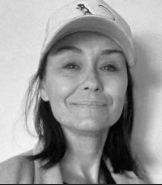
Ángeles Garay Mercado Drugstore